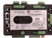
ComAp IntelliGen 200