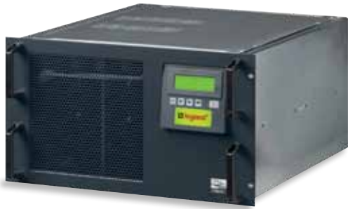
3 103 85