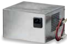
3 107 85