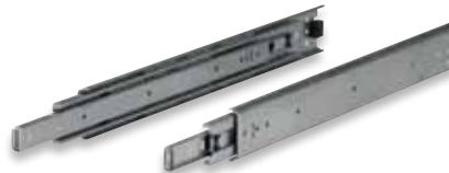
3 109 73