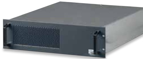
3 107 96