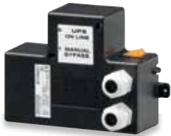
3 108 62